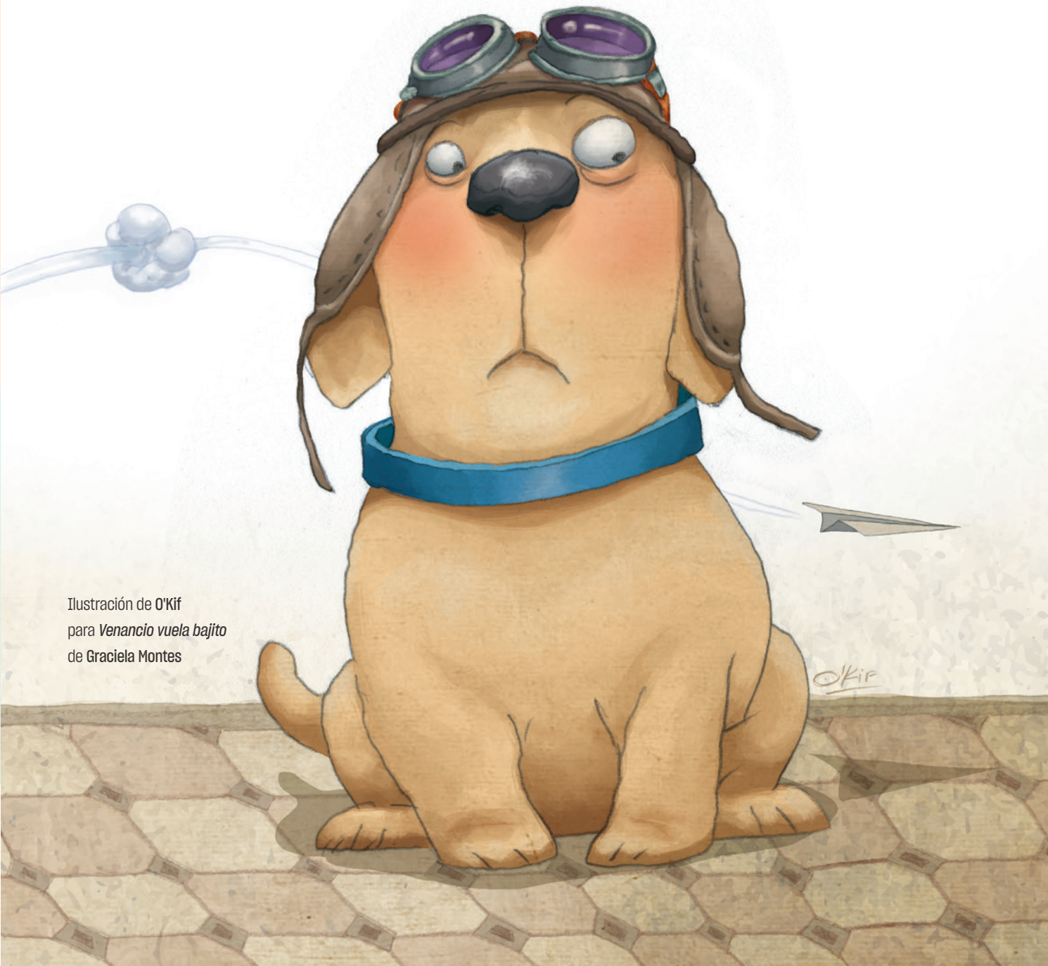
Ilustración de O'Kif para Venancio vuela bajito de Graciela Montes