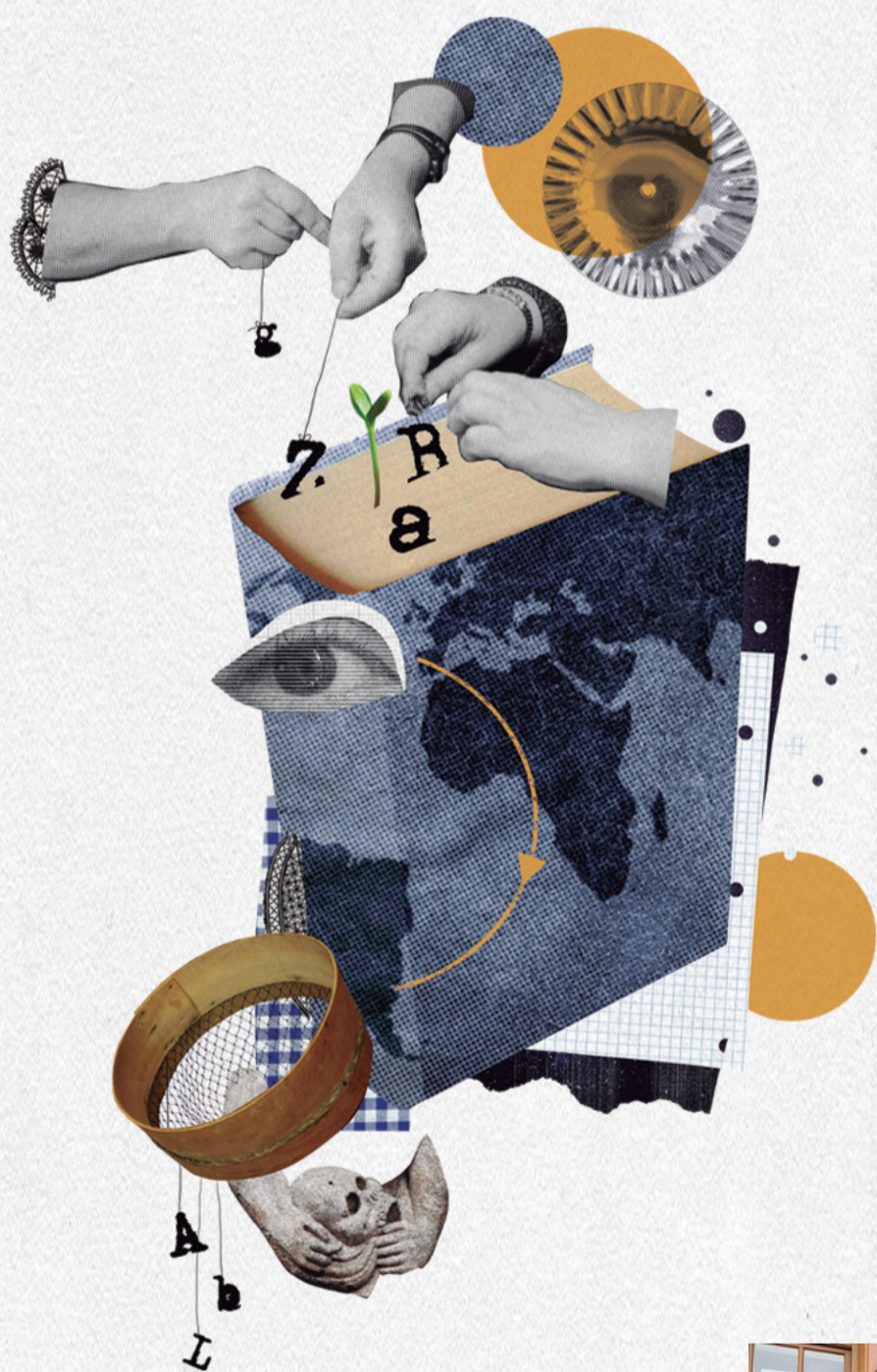
Ilustración: Laura Romero